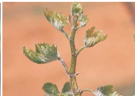
Νεαροί βλαστοί με έντονη προσβολή από ωίδιο ( Uncinula necator )