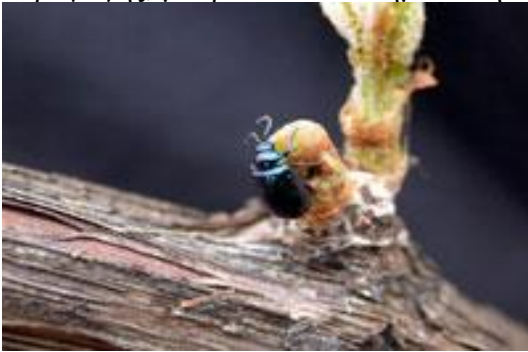
Ακμαίο κολεόπτερο Altica spp. τρεφόμενο σε εκπτυσσόμενους

B1—C3 ), τους οποίους και καταστρέφουν πλήρως. Η δραστηριότητά τους μπορεί να επεκτείνεται και αργότερα στη νεαρή βλάστηση. Σε χρονιές μεγάλων πληθυσμών η καταστροφή των οφθαλμών και συνεπώς της παραγωγής, μπορεί να είναι σημαντική.