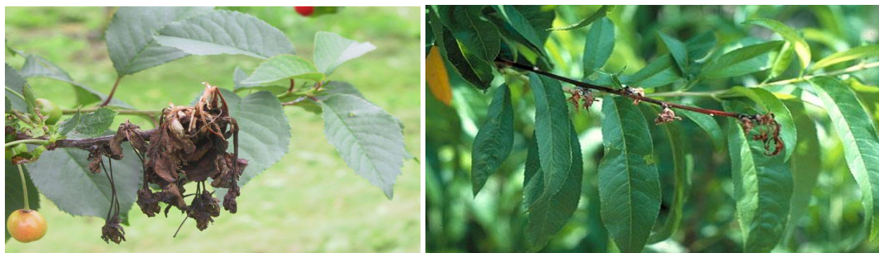
Προσβολή κερασιάς και ροδακινιάς από Μονίλια.

Για την αποφυγή ανάπτυξης ανθεκτικότητας του μύκητα, συνιστάται η συνεχής εναλλαγή μυκητοκτόνων από διαφορετικές χημικές ομάδες.