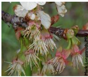
Κερασιά / Βυσσινιά