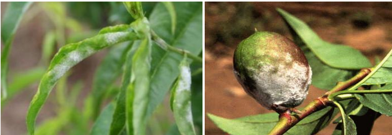
Σύμπτωμα ωιδίου σε νεκταρινιά

Οι ψεκασμοί αυτοί θα μπορούσαν να συνδυαστούν με εκείνο για τη Φαιά Σήψη (Μονίλια).