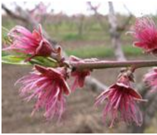
Ροδακινιά / Νεκταρινιά