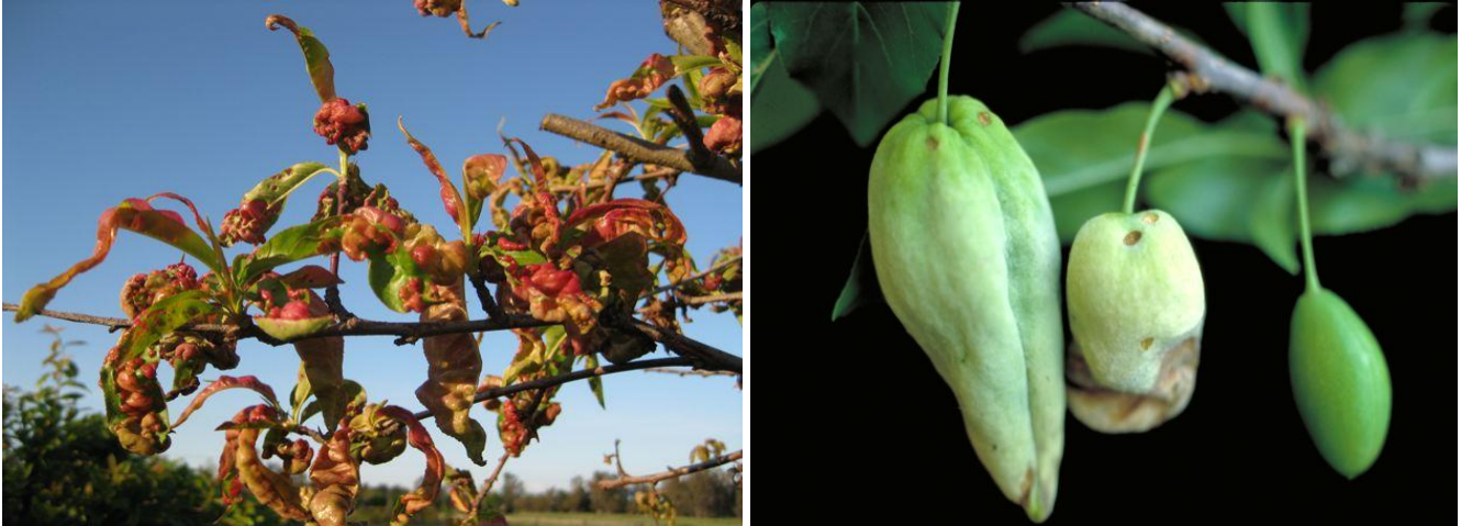
Σύμπτωμα εξώασκου σε φύλλωμα ροδακινιάς και σε καρπούς δαμασκηνιάς

Ο ψεκασμός αυτός θα μπορούσε να συνδυαστεί με εκείνο για τη Φαιά Σήψη (Μονίλια).