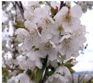
Κερασιά / Βυσσινιά