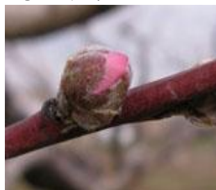
Ροδακινιά / Νεκταρινιά