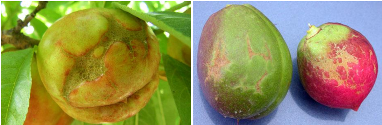
Προσβολή θρίπα σε νεκταρίνια.

Η καταστροφή των ζιζανίων, κυρίως αυτών που είναι ανθισμένα, μέσα και γύρω από τις καλλιέργειες, αποτελεί σημαντικό μέτρο περιορισμού των προσβολών των ανθέων των καλλιεργειών από τους θρίπες.