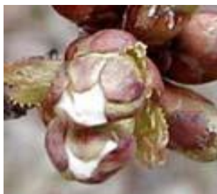
Κερασιά / Βυssινιά