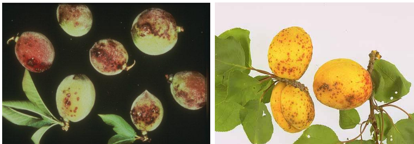
Σύμπτωμα κορύννεου σε ροδάκινα και βερίκοκα

Ο ψεκασμός αυτός θα μπορούσε να συνδυαστεί με εκείνο για τη Φαιά Σήψη (Μονίλια), κάνοντας χρήση μυκητοκτόνου που καταπολεμεί και τις δύο ασθένειες.