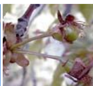
Κερασιά / Βυσσινιά