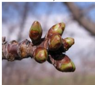
Κερασιά / Βυssινιά