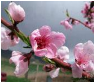
Ροδακινιά / Νεκταρινιά