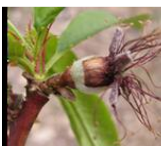
Ροδακινιά / Νεκταρινιά