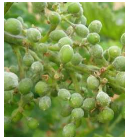
Ωίδιο. Προσβολή σε σταφύλια με εμφάνιση σπορίων.