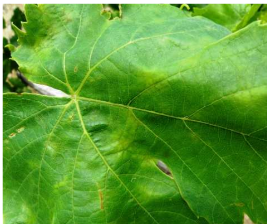
Ωίδιο. Κηλίδες όπως φαίνονται στην πάνω επιφάνεια. Είναι πιο ανοιχτού χρώματος και λιγότερο έντονες από τον περωνόσπορο.