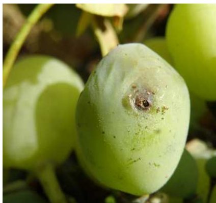
Ευδεμίδα. Προσβολή σε ράγα.