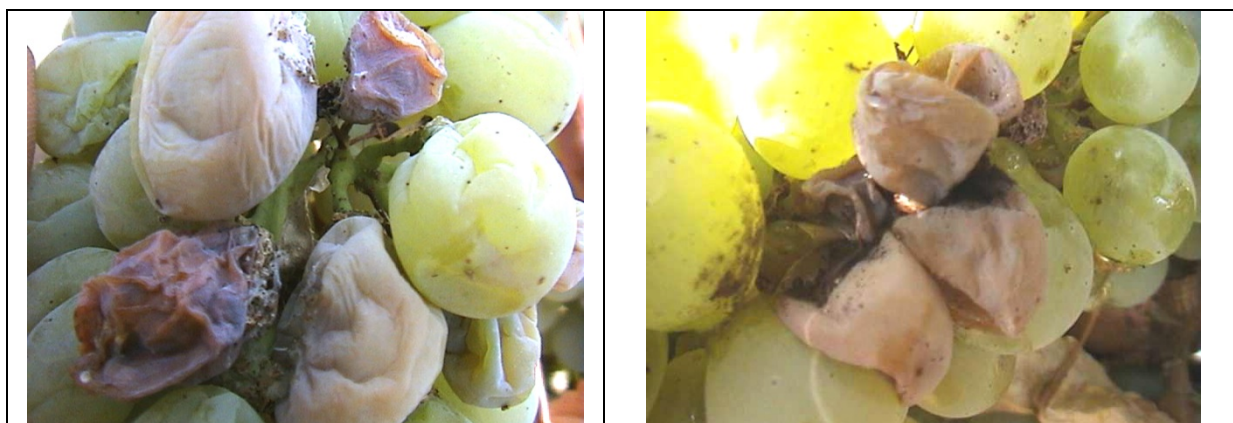
Εικόνα 1. άμεση βλάβη των ραγών από Ευδεμίδα και έμμεση βλάβη από Βοτρυτή