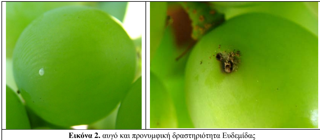
Εικόνα 2. αυγό και προνυμφική δραστηριότητα Ευδεμίδας