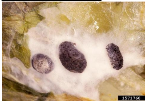
Μυκήλιο & σκληρώτια