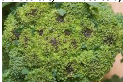
Αλτερνάρια σε Μπρόκολο