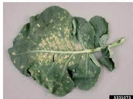
Περονόσπορος σε Λάχανο

Η ασθένεια εκδηλώνεται με τοπικές και διασυστηματικές μολύνσεις. Στις τοπικές μολύνσεις σχηματίζονται υποκίτρινες κηλίδες στα φύλλα, στις κεφαλές του λάχανου μικρές βυθισμένες καστανές κηλίδες, στο κουνουπίδι και μπρόκολο, καστανόμαυρες κηλίδες. Οι διασυστηματικές μολύνσεις (εγκατάσταση του μύκητα στα αγγεία του φυτού) μπορεί να γίνουν από μολυσμένα φύλλα της βάσης. Προκαλείται καστανόμαυρος μεταχρωματισμός των αγγείων του στελέχους και των νεύρων και τελικά νέκρωση. Η ασθένεια ευνοείται σε θερμοκρασίες νύχτας 8-16° C, και θερμοκρασίες ημέρας 24° C, υψηλή υγρασία ομίχλη και βροχές.