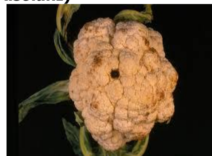
Αλτερνάρια σε κουνουπίδι

Προσβάλλει όλα τα μέρη του φυτού σε όλα τα στάδια ανάπτυξης. Στα νεαρά φυτά προκαλεί λιώσιμο και στα ανεπτυγμένα, κηλίδες σε φύλλα και κεφαλές. Η προσβολή ξεκινά από τα παλαιότερα φύλλα. Εμφανίζονται αρχικά κίτρινες περιοχές και στη συνέχεια εξελίσσονται σε μελανές κυκλικές κηλίδες ελαφρά βυθισμένες στο κέντρο. ►