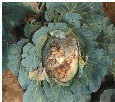
Προσβολή σε λάχανο