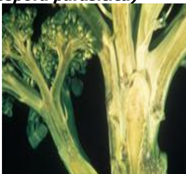
Περονόσπορος σε Μπρόκολο