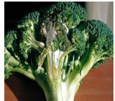
Προσβολή σε Μπρόκολο

Η μόλυνση εμφανίζεται στην περιοχή του λαιμού σαν μαλακή σήψη και επεκτείνεται στη συνέχεια. Με υγρό καιρό σχηματίζεται λευκό πλούσιο μυκήλιο. Ο μύκητας επιβιώνει με τα σκληρώτια σε ξηρό έδαφος για 6-8 χρόνια, καθώς και με το μυκήλιο σε υπολείμματα καλλιέργειας. Μολύνσεις γίνονται σε θερμοκρασίες από 0-25° C με άριστες τους 15-20° C και υψηλή υγρασία.