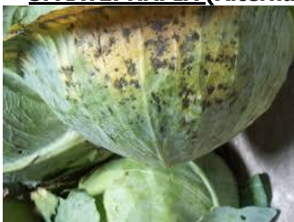
Αλτερνάρια σε Λάχανο