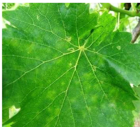
Ωίδιο. Κηλίδες όπως φαίνονται στην πάνω επιφάνεια. Είναι πιο ανοιχτού χρώματος και λιγότερο έντονες από τον περονόσπορο..