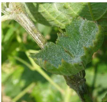
Ωίδιο. Αλευρώδες επίχρισμα (σπόρια) σε φύλλα - βλαστό και κατοάρωμα του φύλλου.