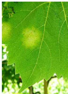
Περονόσπορος. Κηλίδες λαδιού στην πάνω επιφάνεια του φύλλου.