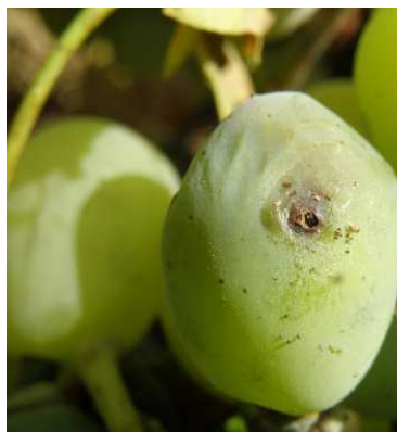
Ευδεμίδα. Προσβολή σε ράγα.