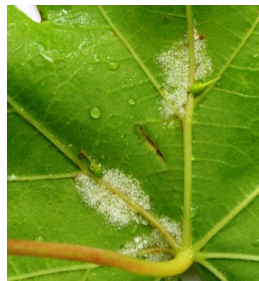
Περονόσπορος. Οι «λαδιές» με υγρασία δίνουν λευκές χιονώδεις εξανθήσεις μόνο στην κάτω πλευρά του φύλλου.