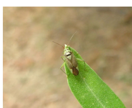
ΚΑΛΟΚΟΡΗ ( Calocoris trivialis )