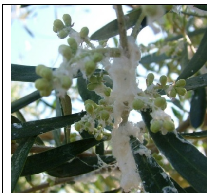
ΒΑΜΒΑΚΑΔΑ ( Euphyllura phillyreae )