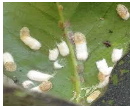
Cottony camellia scale insects and ovisacs on the underside of a camellia leaf.