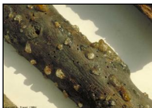
Προσβολές από Scolytus