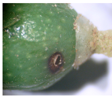
Ρυγχίτης: Προσβολή ενηλίκων σε μικρό καρπό. Διακρίνεται η τρύπα μορφής «κρατήρα».