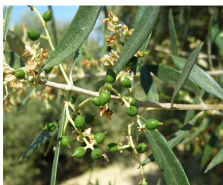
Ολοκλήρωση καρπόδεσης - Καρποί μεγέθους σταριού