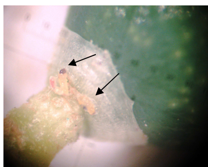
Πυρηνοτρήτης: Αυγό σε στάδιο εκκόλαψης και δίπλα προνύμφη που μόλις εκκολάφθηκε.