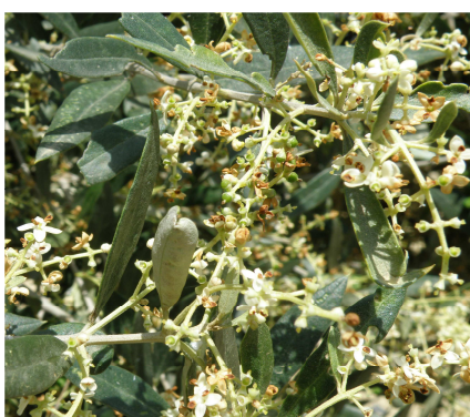
Πτώση πετάλων - καρπόδεση