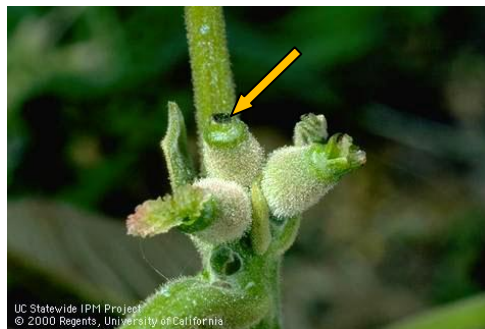
Εικ. 3. Προσβολή θηλυκού άνθους