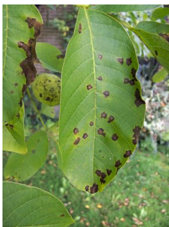
Εικ. 10. Προσβολή φύλλου