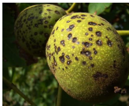
Εικ. 11. Προσβολή καρπού