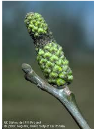
Εικ. 1 & 2. Προσβολή ιούλων