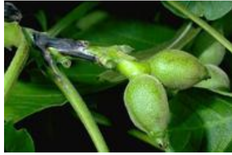
Εικ. 7. Προσβολή τρυφερού βλαστού