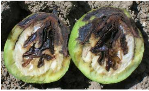
Εικ. 6. Μαύρισμα ψίχας