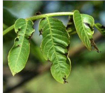
Εικ. 8 & 9. Προσβολή φύλλων