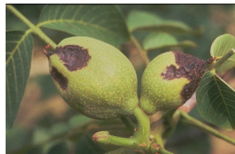
Εικ. 4 & 5. Προσβολή καρπών