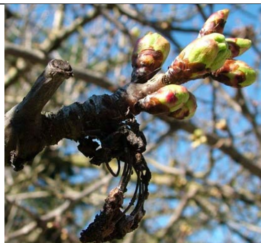
προσβολή από Μονιλία