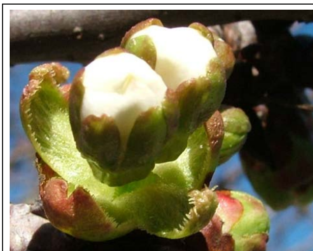
στάδιο D Λευκή κορυφή