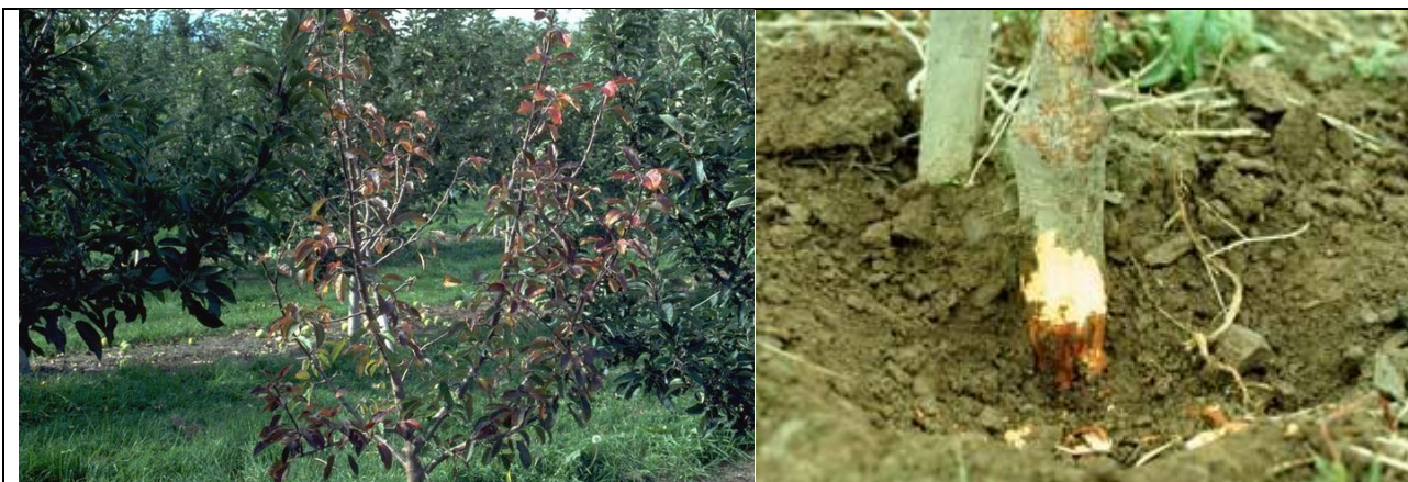
προσβολή Μηλιάς από Phytophthora