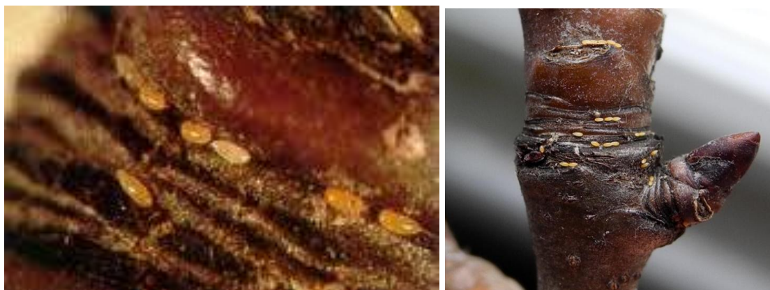
Εικ. Ωά ψύλλας ανάμεσα σε ρυτιδώματα της βάσης ανθοφόρων οφθαλμών της αχλαδιάς.

Λίγο αργότερα και κατά τη βλαστική περίοδο, οι λαίμαργοι βλαστοί πρέπει να απομακρύνονται με το χέρι όταν είναι ακόμη τρυφεροί, διότι συγκεντρώνουν μεγάλο πληθυσμό του εντόμου.