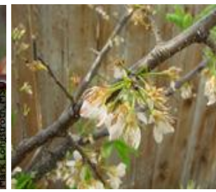
Ροδακινιά / Νεκταρινιά