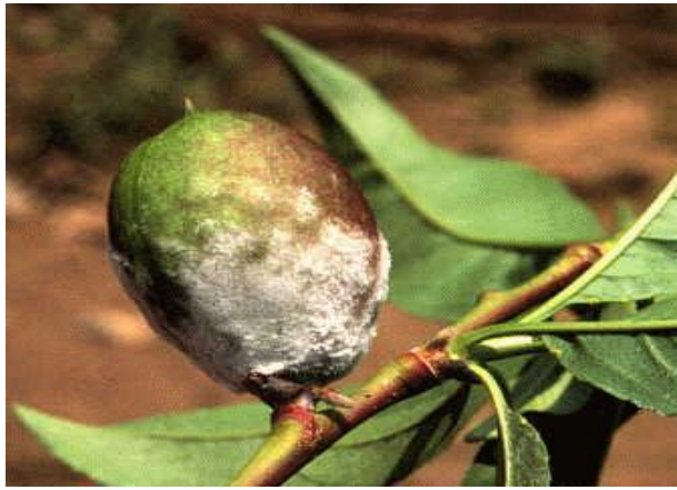
Σύμπτωμα ωιδίου σε νεκταρινιά