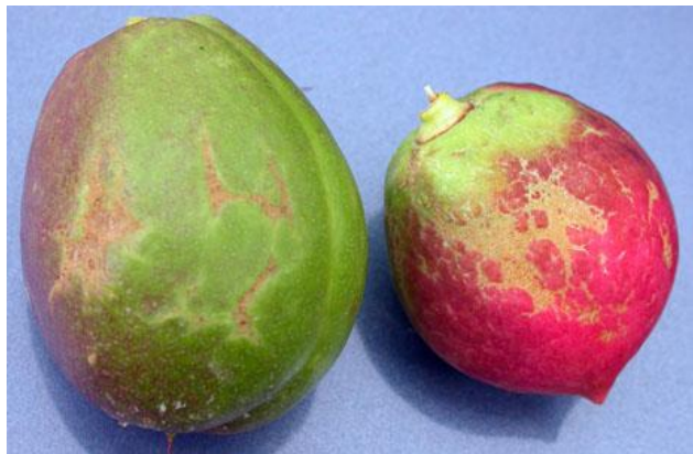
Προσβολή θρίπα σε νεκταρίνια.