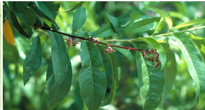
Προσβολή κερασιάς και ροδακινιάς από Μονίλια.