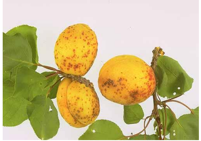
Σύμπτωμα κορύνεου σε ροδάκινα και βερίκοκα