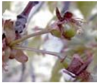
Κερασιά / Βυσσινιά