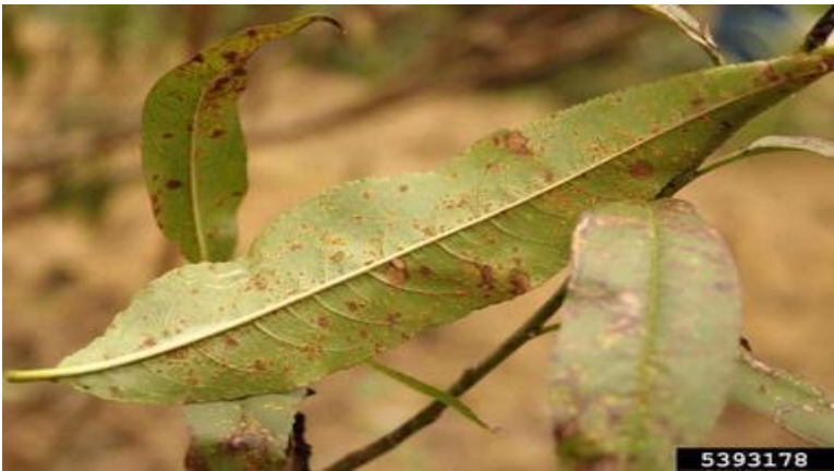
Σύμπτωμα σκωρίασης σε φύλλα ροδακινιάς.

Ο ψεκάσμος αυτός θα μπορούσε να συνδυαστεί με εκείνο για τη Φαιά Σήψη (Μονίλια)