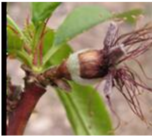
Ροδακινιά / Νεκταρινιά