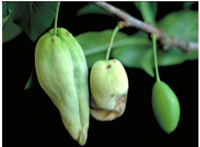
Σύμπτωμα εξώασκου σε φύλλωμα ροδακινιάς και σε καρπούς δαμασκηνιάς