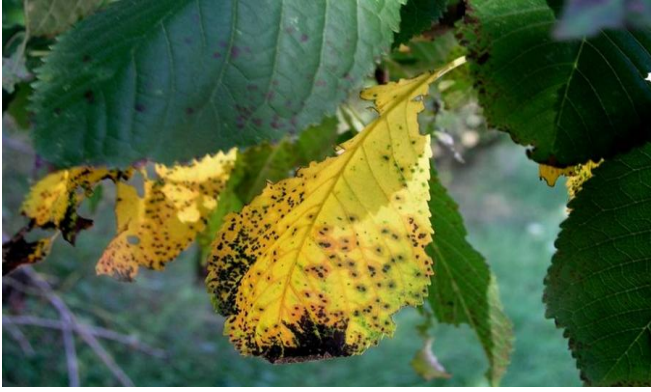
Σύμπτωμα κυλινδροσπορίωσης σε φύλλα κερασιάς