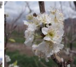
Ροδακινιά / Νεκταρινιά