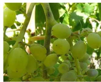
Ωίδιο. Προσβολή σε άζονες και μίσχους σταφυλιών.

Πληροφορίες: Νίκος Ι. Μπαγκής - Βαγγέλης Α. Αλατσατιανός