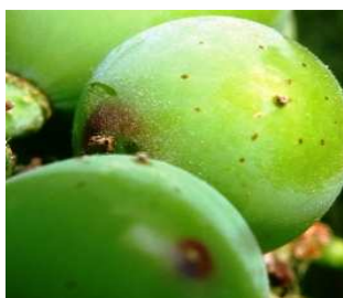
Ευδεμίδα. Προσβολή σε ρώγα.