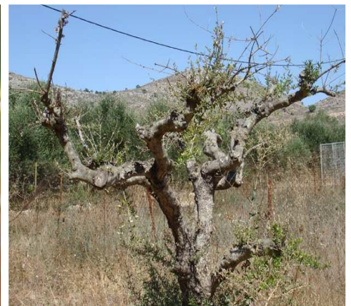
Έντονη ζημιά από προνύμφες μαργαρόνιας στη νεαρή βλάστηση αυστηρά κλαδεμένου δέντρου.