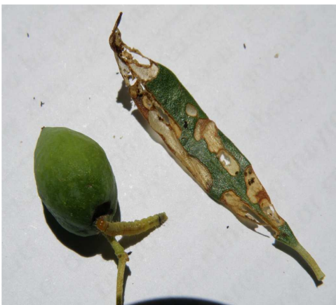
Προνύμφη μαργαρόνιας με προσβολή σε φύλλο και καρπό ελιάς.