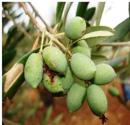
Καρποί ελιάς προσβεβλημένοι από μαργαρόνια.