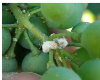
Ψευδόκοκκος. Ωσοωροί και έρπουσες σε σταφύλια.