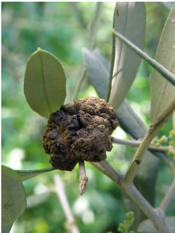
Καρκίνωση: Όγκος σε κλαδί ελιάς.