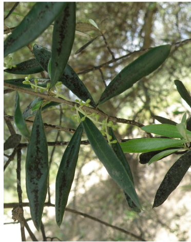
Καπνιά: Μαυρίλα στην επιφάνεια φύλλων και βλαστών.