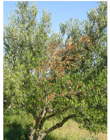
Ξυλοφάγα έντομα: Ξήρανση λεπτών κλαδιών