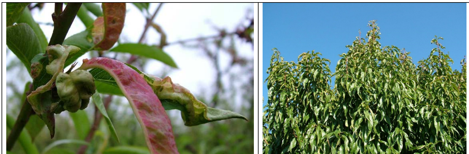
προσβολή από εξώασκο