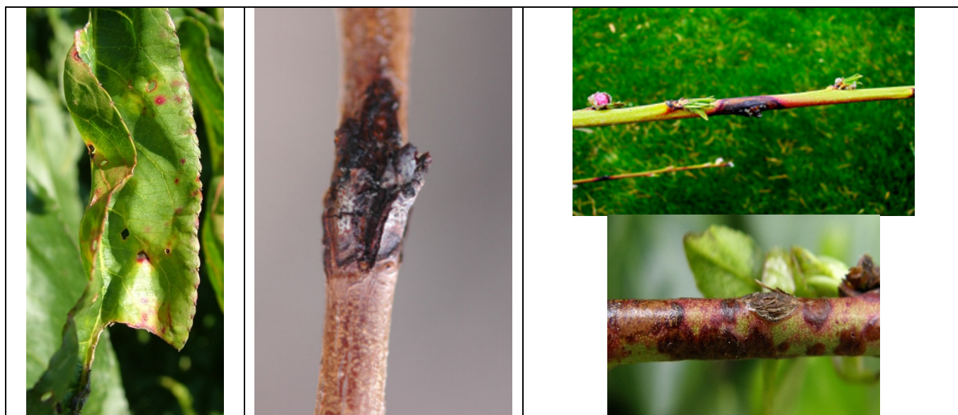
προσβολή από κορύνεο