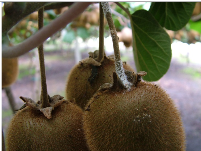
προσβολή από βαμβακάδα σε Ροδακινιά και Ακτινιδιά