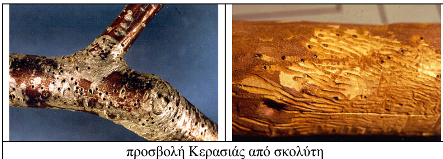
προσβολή Κερασιάς από σκολύτη