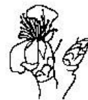
Η Πτώση των πετάλων