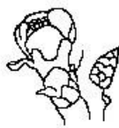
Ε Οι στήμονες διακρίνονται