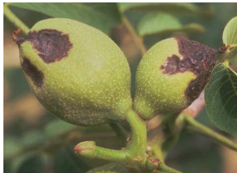
Εικ.3 Προσβολή βακτηρίωσης σε αναπτυγμένο καρπό