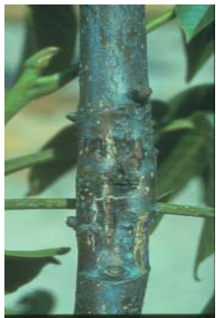
Εικ.1 Προσβολή βακτηρίωσης σε νεαρό βλαστό