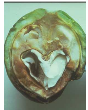
Εικ.4 Μεταχρωματισμός της ψίχας λόγω της βακτηρίωσης