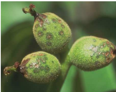
Εικ.2. Προσβολή βακτηρίωσης σε καρτίδιο