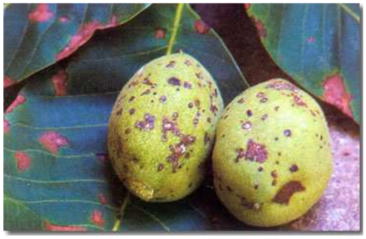
Εικ.6 Προσβολή ανθράκωσης σε αναπτυγμένο καρπό

Πληροφορίες : Ν. Ι. Μπαγκής,- Ε. Α. Αλατσατιανός