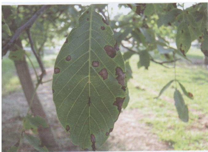
Εικ.5 Προσβολή ανθράκωσης σε φύλλο.