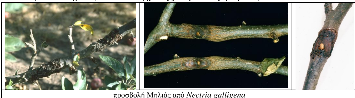
προσβολή Μηλιάς από Nectria galligena