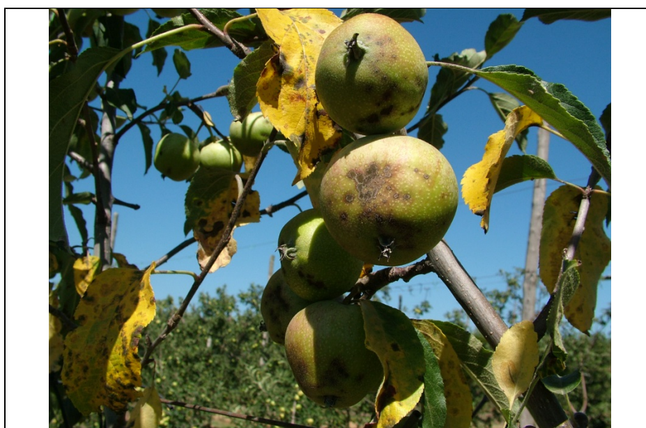
έντονη προσβολή Μηλιάς από φουζικλάδι