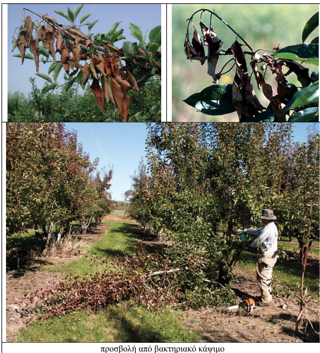
προσβολή από βακτηριακό κάψιμο