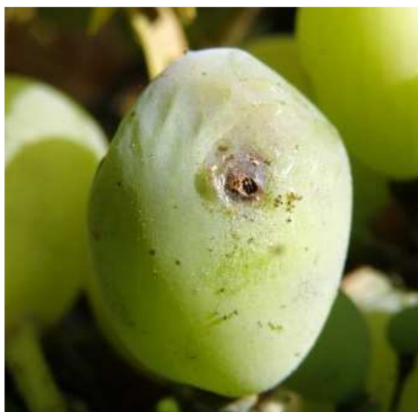
Ευδεμίδα. Προσβολή σε ράγα. Διακρίνεται η τρύπα. Στην «χτυπημένη» ράγα εξελίσσονται δευτερογενώς σήψεις.

Πληροφορίες: Νίκος Ι. Μπαγκής - Βαγγέλης Α. Αλατοσατιανός