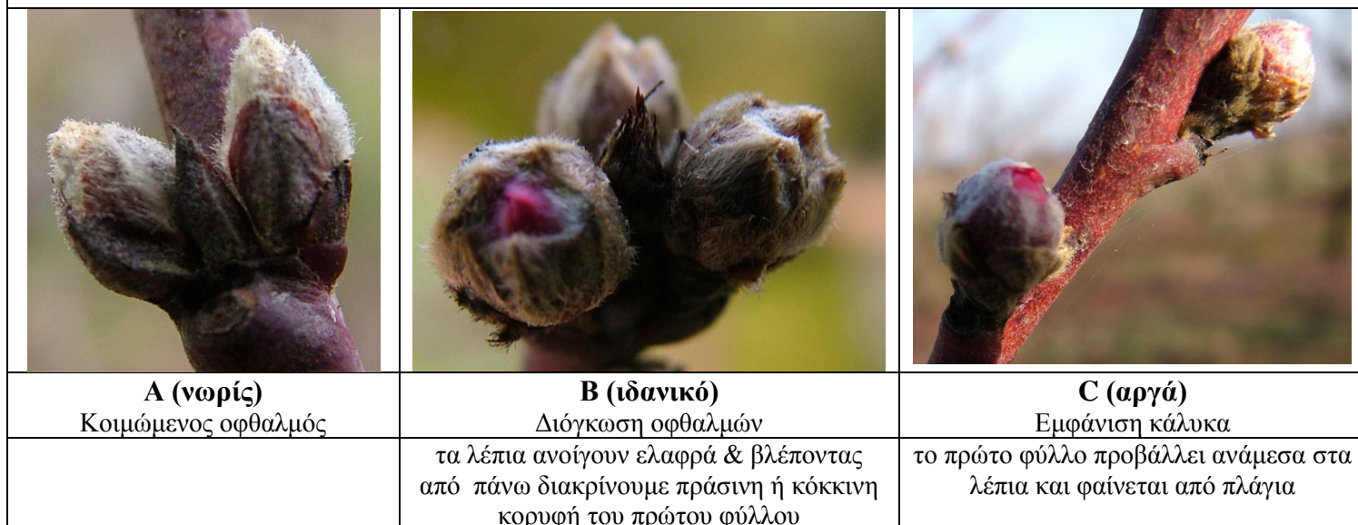
Εικόνα 1. στάδια ΡΟΔΑΚΙΝΙΑΣ