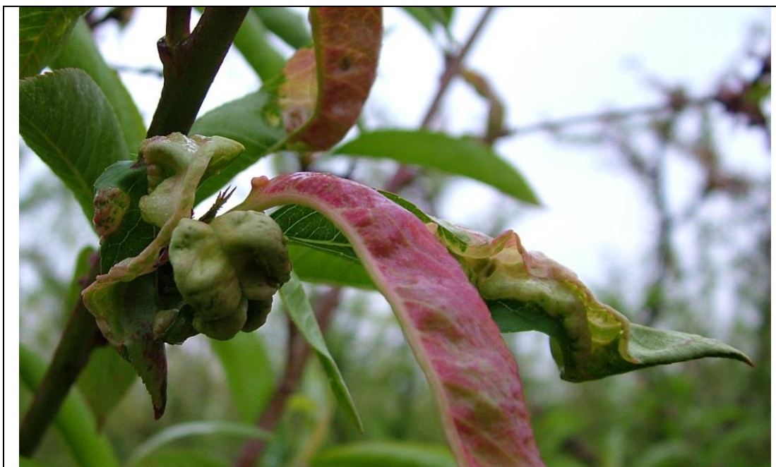
Εικόνα 2. Προσβολή από Εξώασκο

καρούλιασμα ολόκληρου του φύλλου προς τα κάτω ή μόνο του βασικού μέρους κόκκινος μεταχρωματισμός του ελάσματος