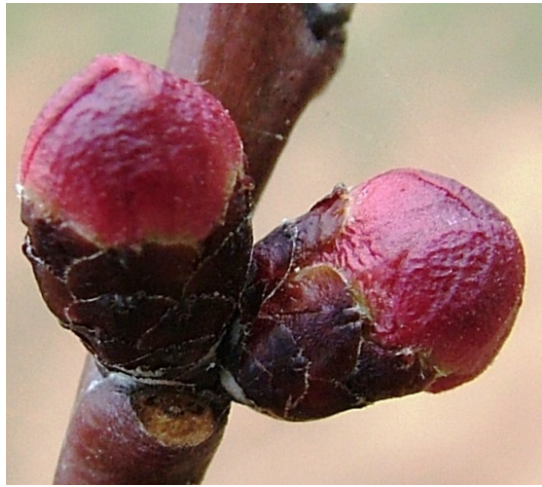
Εμφάνιση κάλυκα (ρόδινη κορυφή) Βερικοκιά