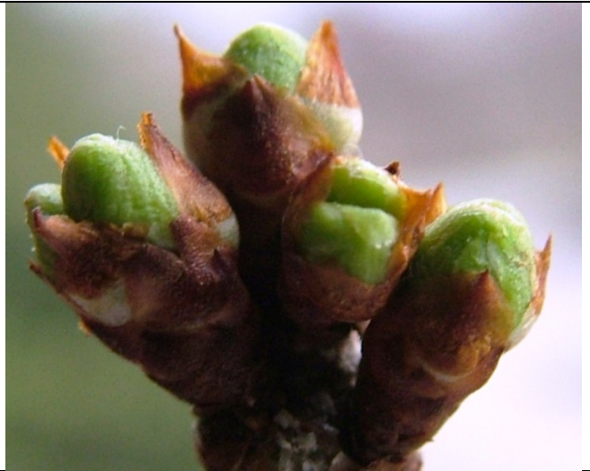
Πράσινη κορυφή Δαμασκηλιά