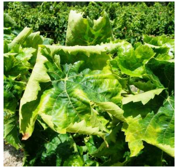
Τζιτζικάκι. Καρούλιασμα και μεταχρωματισμός σε φύλλα σουλτανί. Στις ερυθρές ποικιλίες ο μεταχρωματισμός είναι κοκκινωπός.