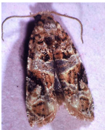
Ευδεμίδα. Τέλειο έντομο. Πεταλούδα περίπου 1εκ.