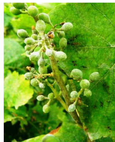
Ωίδιο. Σε νεαρές ράγες