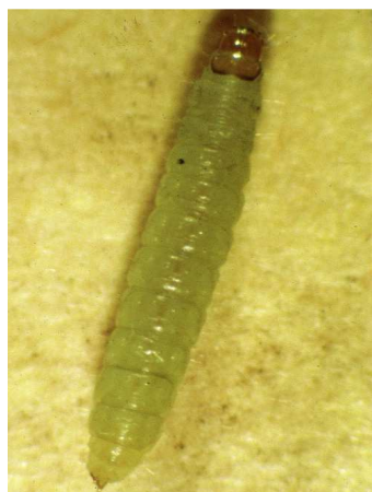
Ευδεμίδα. Προνύμφη πολύ ευκίνητη, μέχρι 1εκ. μήκος.