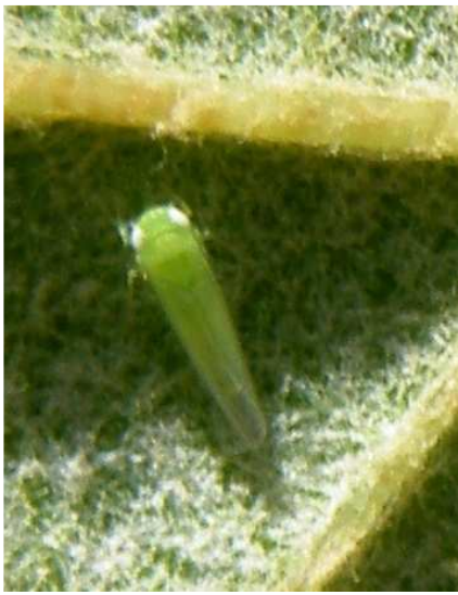
Τζιτζικάκι. Ενήλικο (περωτό) έντομο. Είναι τα μεταναστευτικά άτομα του είδους.