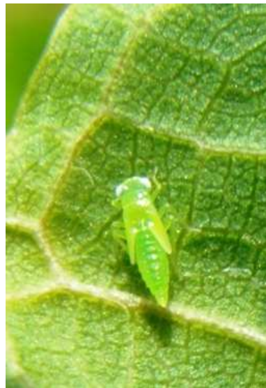
Τζιτζικάκι. Προνύμφη του εντόμου. Δεν πετά, είναι στην κάτω πλευρά του φύλλου, βαδίζει με πλάγια κίνηση.