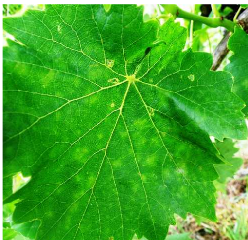
Ωίδιο. Μολύνσεις στο φύλλωμα

Ευδεμίδα. Αυγά σε νεαρές ράγες (αριστερά) ευδιάκριτα με γυμνό μάτι (μέγεθος κεφαλής καρφίτσας), και αυγά σε μεγέθυνση (στο κέντρο πρώτης μέρας πρόσφατα τοποθετημένο και δεξιά έτοιμο να εκκολαφθεί – ορατή η κουλουριασμένη προνύμφη με καστανό κεφάλι).