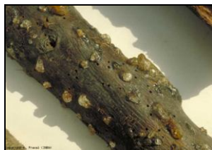
Προσβολές από Scolytus