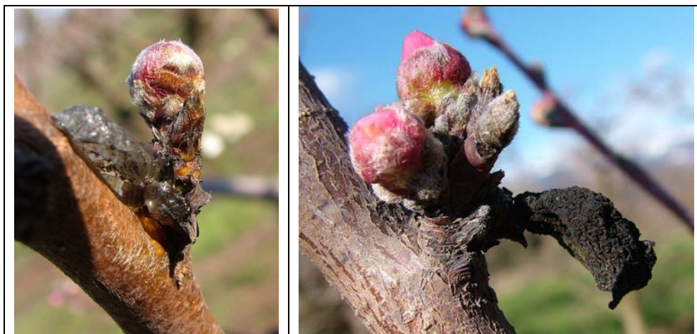
Εικόνα 1. Προσβολή από Μονιλία σε κλαδιά και καρπούς