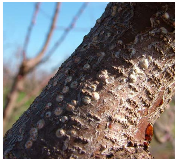
Παρουσία ασπιδίων βαμβακάδας στο 25%