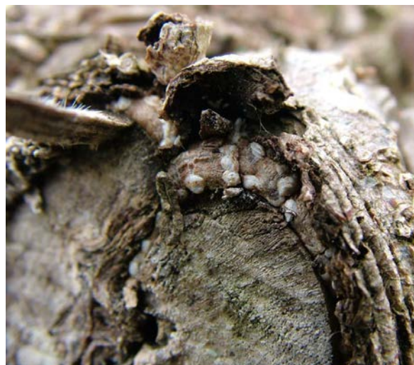
Εικόνα 4. Προσβολή ακτινιδιάς από βαμβακάδα

ΤΑ ΑΓΡΟΧΗΜΙΚΑ ΝΑ ΧΡΗΣΙΜΟΠΟΙΟΥΝΤΑΙ ΠΑΝΤΟΤΕ ΣΥΜΦΩΝΑ ΜΕ ΤΗΝ ΕΤΙΚΕΤΑ.