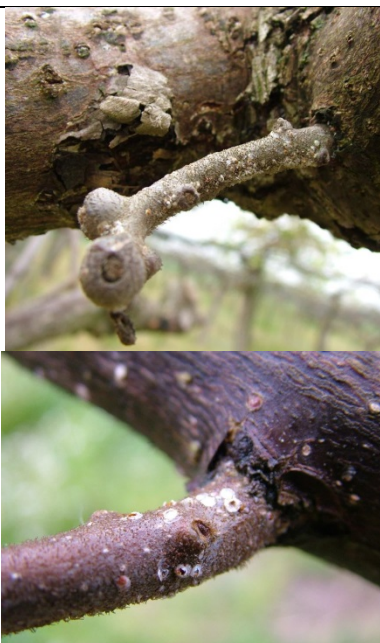
Εικόνα 3. Προσβολή ροδακινιάς από βαμβακάδα