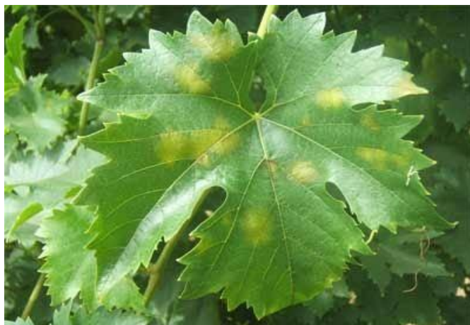
Προχωρημένη προσβολή φύλλων, όπως αυτή φαίνεται στην πάνω επιφάνεια.