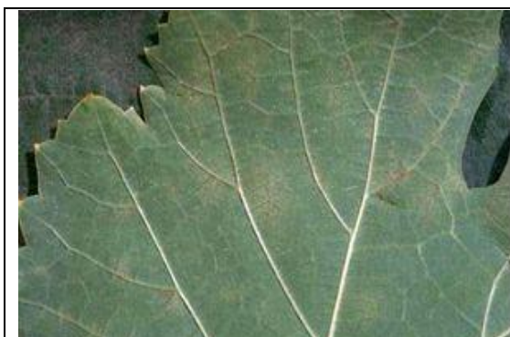
Ίχνη (ελάχιστες κηλίδες προσβολής ή κανένα σύμπτωμα, ούτε μυκήλιο ούτε ορατή καρποφορία του μύκητα, μόνο ένα μικρό κατσάρωμα του ελάσματος)