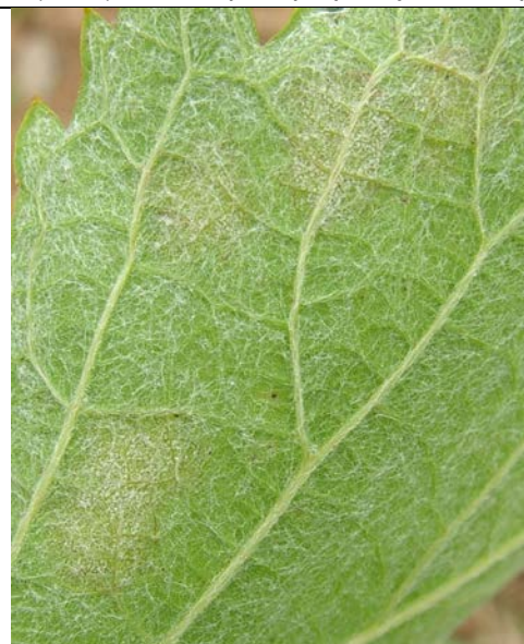
επάνθηση (καρποφορία του μύκητα) στην κάτω επιφάνεια του φύλλου