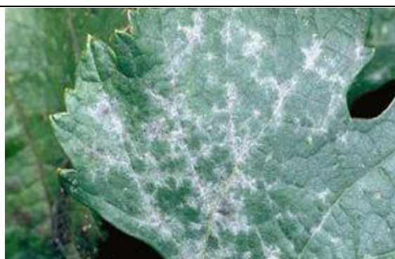
Μέτρια (εμφανείς αρκετές κηλίδες προσβολής, συνήθως περιορισμένες σε διάμετρο 2-5 εκατ)