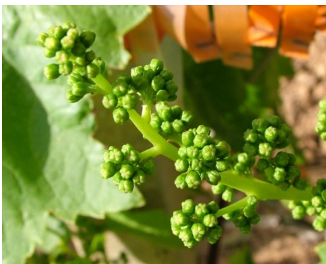
Η Ανθοταξίες πλήρως ανεπτυγμένες