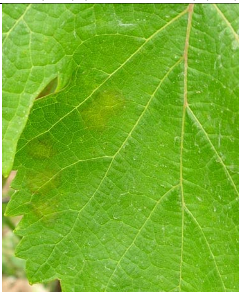
κηλίδες λαδιού στην πάνω επιφάνεια του φύλλου