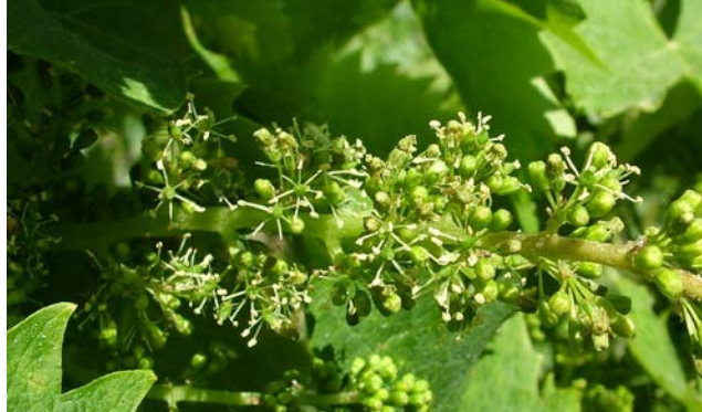
Γ' Εναρξη άνθησης