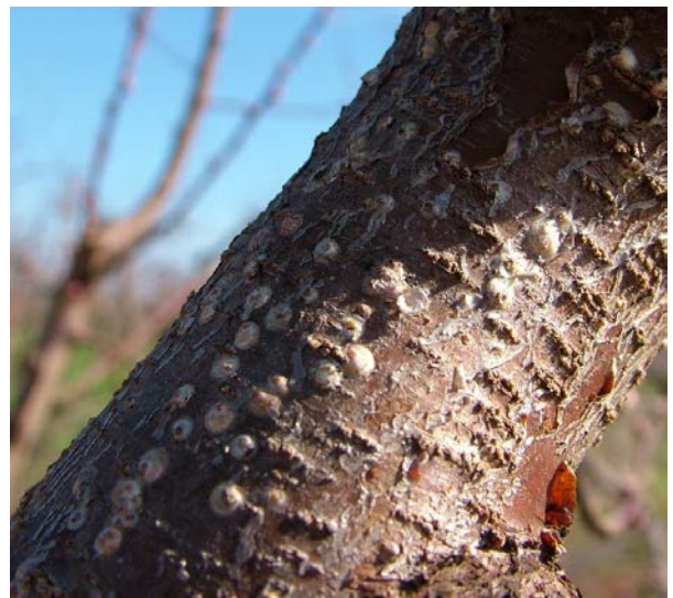
Παρουσία ασπιδίων βαμβακάδας στο 25%