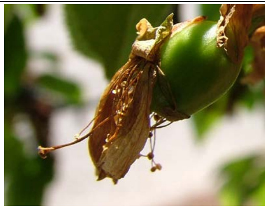
Ι Απόσπαση του κάλυκα