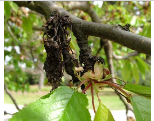
Gnomonia erythrostoma Προσβολή