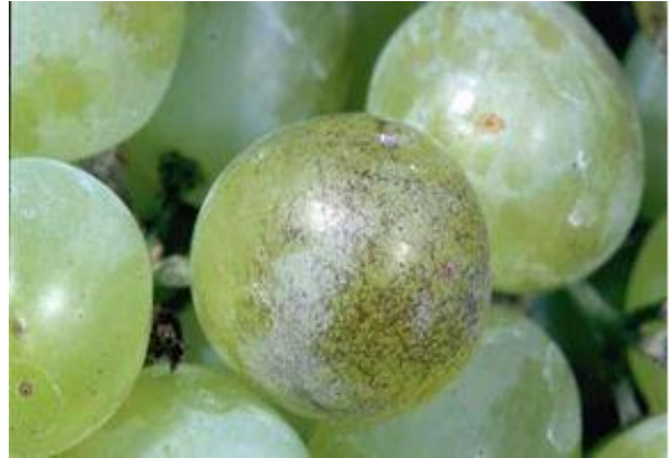
Εικόνα 1. προσβολή ωιδίου σε ράγες