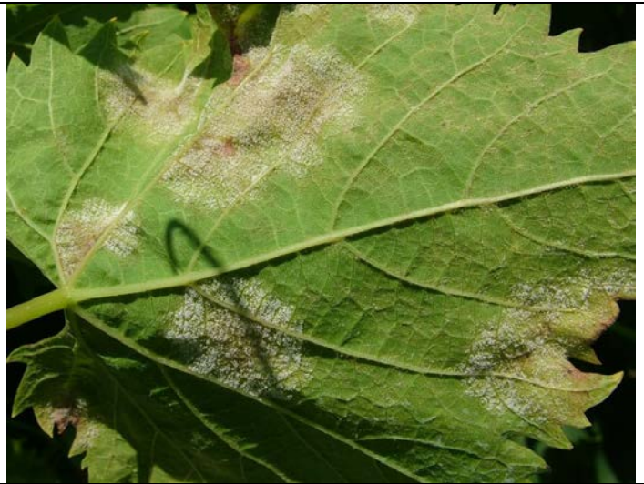
Εικόνα 2. σημαντική προσβολή περονόσπορου