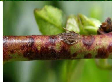
προσβολή από κορύνεο