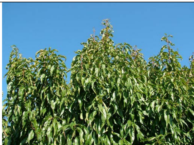
προσβολή από εξώασκο