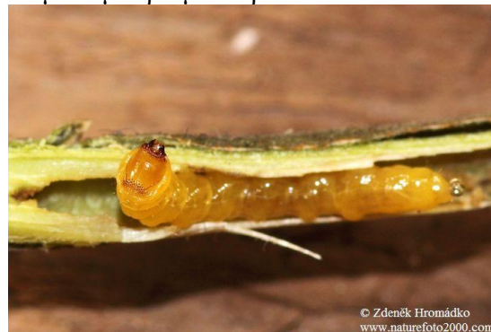
Προνύμφη έως 20 μμ

Ακμαίο και χαρακτηριστική δακτυλιοειδής προσβολή.