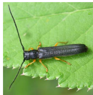
Ακμαίο μαύρο με κίτρινα πόδια 11-14 mm