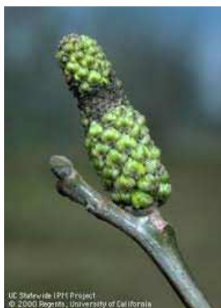
Εικ. 1 & 2. Προσβολή ιούλων