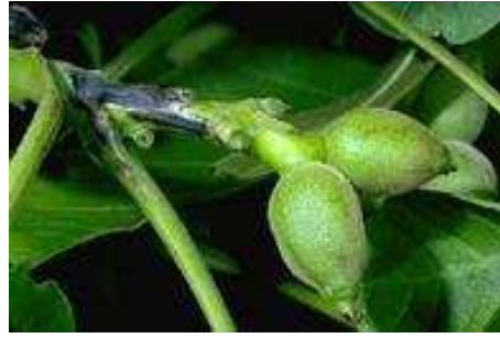
Εικ. 7. Προσβολή τρυφερού βλαστού