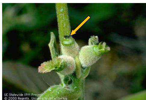
Εικ. 3. Προσβολή θηλυκού άνθους