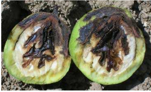
Εικ. 6. Μαύρισμα ψίχας