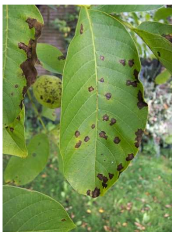
Εικ. 10. Προσβολή φύλλου