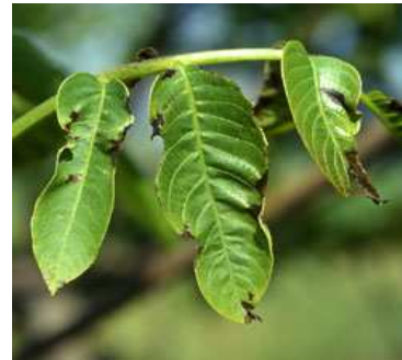
Εικ. 8 & 9. Προσβολή φύλλων