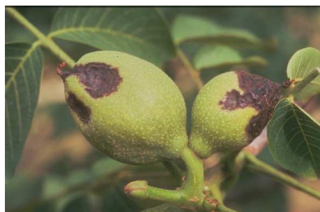
Εικ. 4 & 5. Προσβολή καρπών