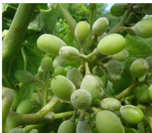
Ωίδιο. Σοβαρή προσβολή σε ράγες, άξονες και μίσχους των σταφυλιών.