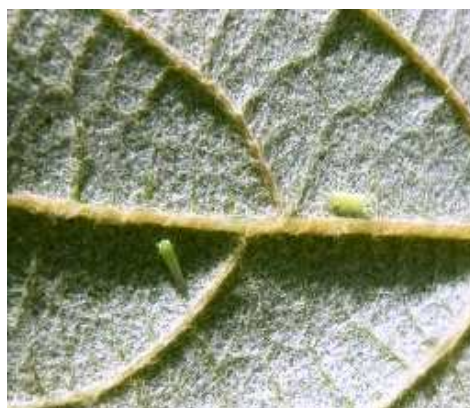
Τζιτζικάκι. Ενήλικα άτομα σε φύλλο.