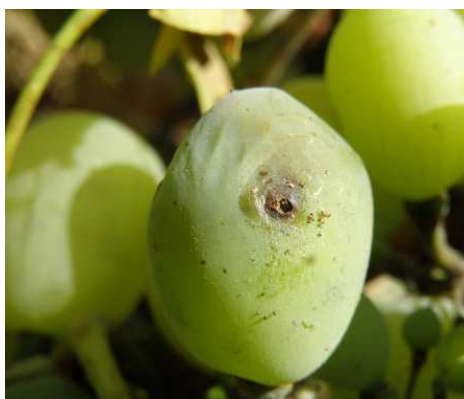
Ευδεμίδα. Προσβολή σε ράγα.