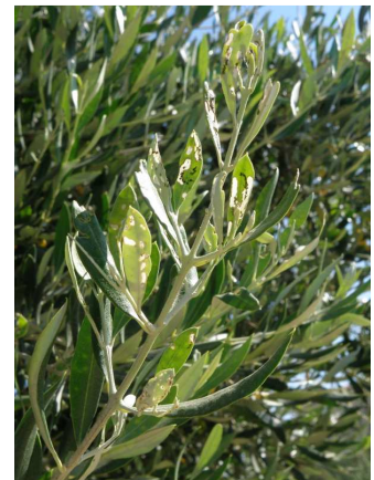
Προσβολή ακραίας βλάστησης από μαργαρόνια.