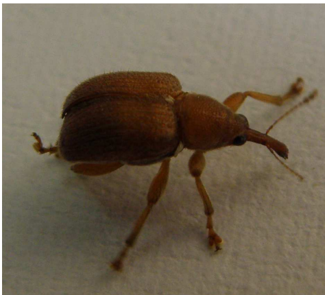
Ενήλικο ρυγχίτη με το χαρακτηριστικό ρύγχος.