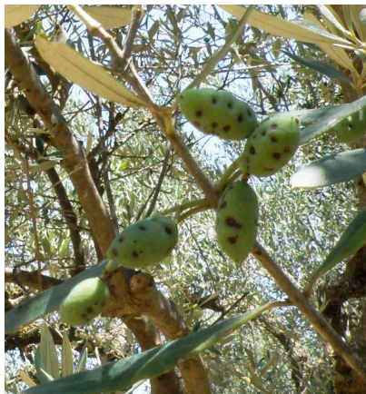
Έντονη προσβολή από ρυγχίτη. Διακρίνονται χαρακτηριστικές οπές μορφής «κρατήρα».